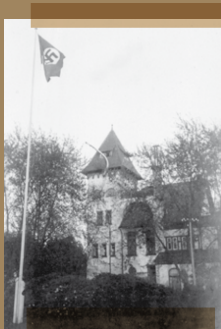
Verwaltungsgebäude der Bremer Nervenklinik, um 1933

Zeitzeugen und Zeitzeuginnen erzählen aus ihrer Kindheit und Jugend im Nationalsozialismus. Angehörige – Erwachsene, Jugendliche, Kinder – ihrer Familien sind Opfer von Medizinverbrechen geworden. Jahrelang fehlte ihnen die Gewissheit, was in der Zeit des Nationalsozialismus wirklich mit den Eltern, Geschwistern, Tanten und Onkeln passiert ist. Denn die Wahrheit über die Verbrechen – wie dem Mord an Behinderten und Psychatriepatienten und der Zwangssterilisation tausender Frauen und Männer – wurde nicht nur in Politik und Gesellschaft, sondern auch in den Familien selbst meist verschwiegen.