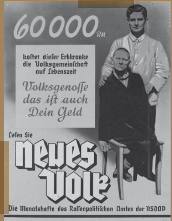
Propaganda gegen psychisch Kranke. Neues Volk, Die Monatshefte des Rassenpolitischen Amtes der NSDAP, um 1938