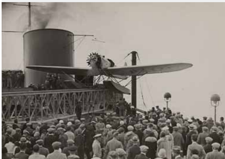
Katapult-Flugzeug vor dem Start

Ort Focke-Museum, Schwachhauser Heerstraße 240