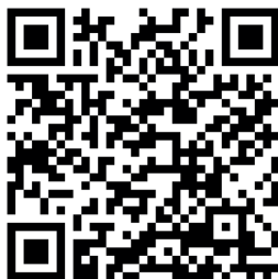
Sign-In (für den erstmaligen Zugriff)

Folgende QR-Codes führen zum itslearning-Kurs " Unterstützung KompoLei ":