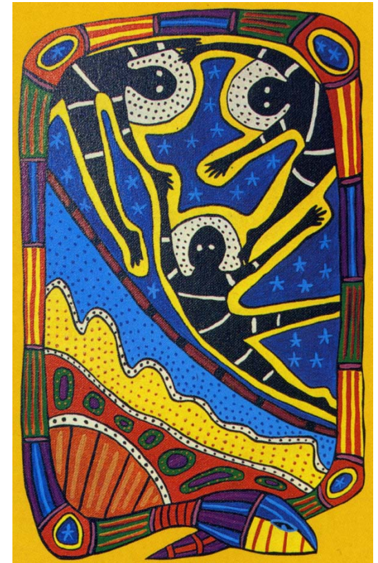
Sally Morgan „My Place“ Virago Press 1988